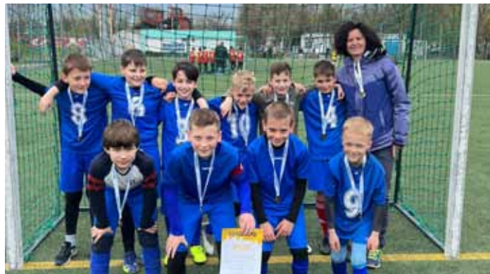
A megyei elődöntős csapatunk"