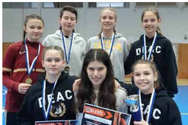
A kosárlabda csapatunk