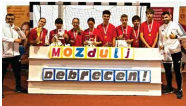
A váltóverseny tagjai