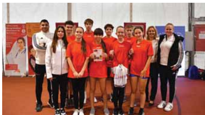
A győztes csaptaunk