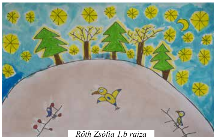
Róth Zsófia 1.b rajza