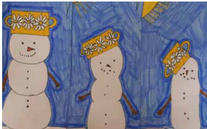
Bécsi Erzsébet 4c